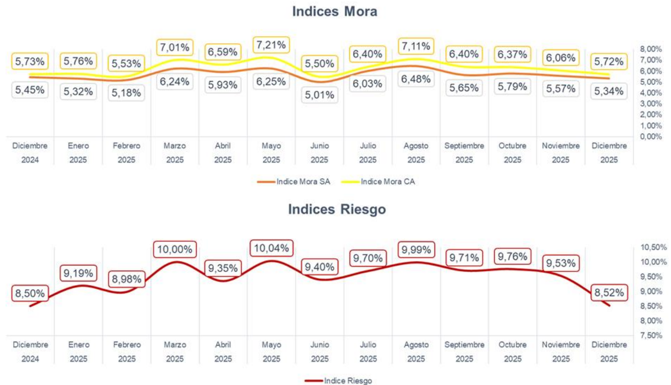
Gráfica 2 Evolución indicadores de cartera.